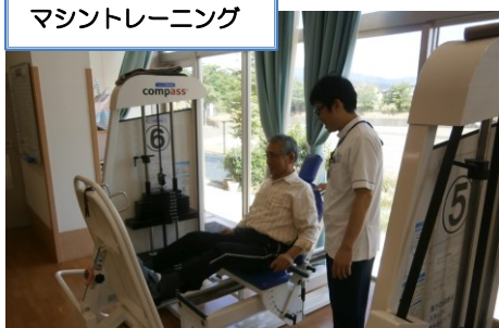
マシントレーニング