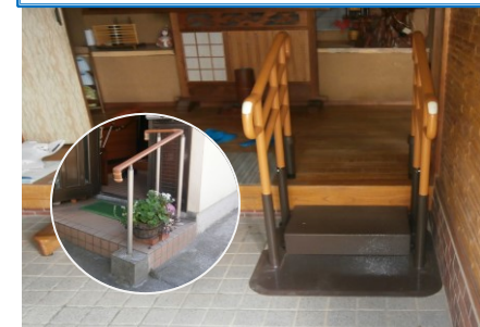
訪問指導（福祉用具の選定・住宅改修などのご提案）

自宅での生活で不安な事がありましたらご自宅に訪問して必要な福祉用具の選定や住宅改修などのご提案をさせていただきます。