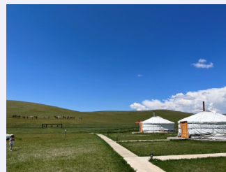
モンゴル 草原の中のゲル